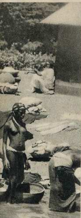
.. Le dimanche, avec les copains au bord du Niger...

— Et puis après ! Je suis passé par Rochefort, l'Ecole des spécialistes de