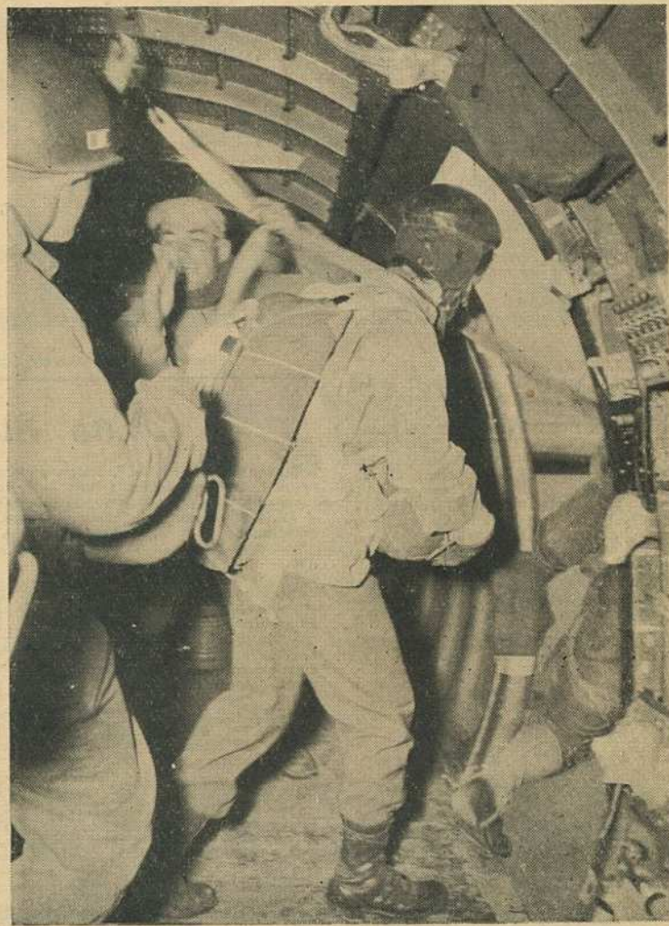
Ils vont pour le saut.

Interrogez les combattants alliés, ils vous diront que leur ravitaillement en essence et mu-