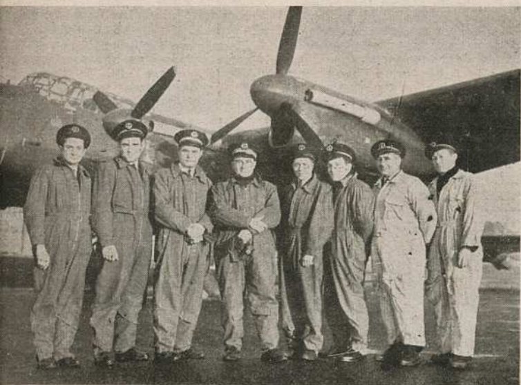
L'équipage de l'Aéronautique Navale française qui est allé prendre livraison en Grande-Bretagne du premier quadrimoteur Liberator destiné à la défense des communications françaises.