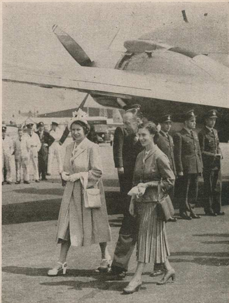
S. M. la Reine Elisabeth II d'Angleterre est une fervente d'aviation. On la voit ici, alors Princesse Royale, en compagnie de sa sœur, la Princesse Margaret, descendant d'avion à l'aéroport de Londres.